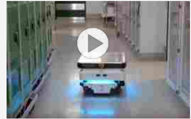
Robot mobili autonomi MiR, automazione sicura negli ospedali