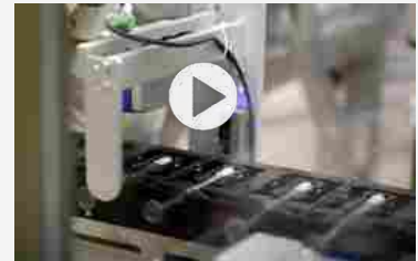
Sensoristica Wenglor nel packaging di Marchesini Group