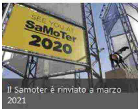
Il Samoter è rinviato a marzo 2021