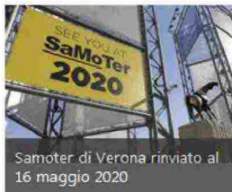
Samoter di Verona rinviato al 16 maggio 2020