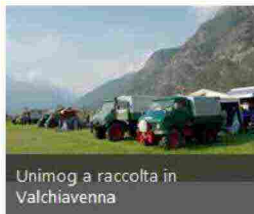
Unimog a raccolta in Valchiavenna