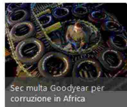
Sec multa Goodyear per corruzione in Africa