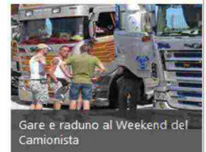
Gare e raduno al Weekend del Camionista